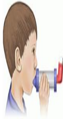
۳. تمام هوای درون ریه خود را خالی کنید و سپس اسپیسیر را در دهان گذاشته و با دندان و لبهای خود محکم بگیرید.