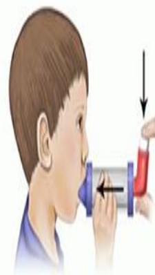
۴. اسپری دارو را یک بار فشار داده (پاف) و به آرامی و عمیق نفس بکشید.